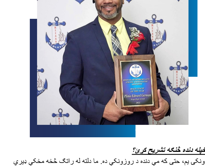
تاسو به خپله لنډه څنگه تشریح کړئ؟

پلینو "او" جرمن د ابتدایي ښوونځي، ویلیم ډی ایبټ ابتدایي د نويې ښوونځي مدیر د ریسلینګ مشر روزونکي، هوب عالي لیسې موقیعت یې: ویلیم ډی ایبټ ابتدایي په PPSD کې شمولیت: 2005