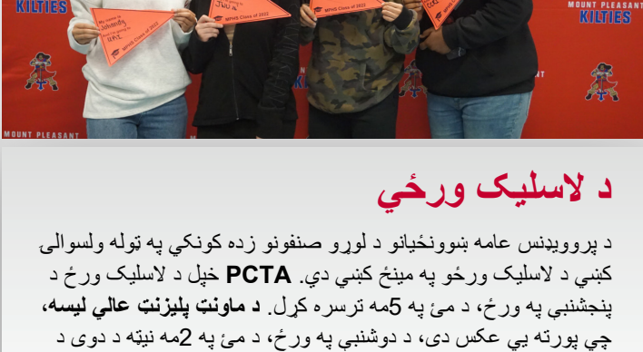
د لاسلیک ورځي

په براد سړک کې د ایلان شان فیلسټین د منځني ښوونځي څلورم ټولګي زده کوونکي خوشبخته وو چې د امریکایي لوستلو شرکت لیکوال ایوان کاسن د دوی له ټولګي څخه لیدنه وکړه! زده کوونکو د ټولګي په جریان کې چې د لیکوال د نظر په اړه یې څه زده کړل یوه مقاله ولیکل.