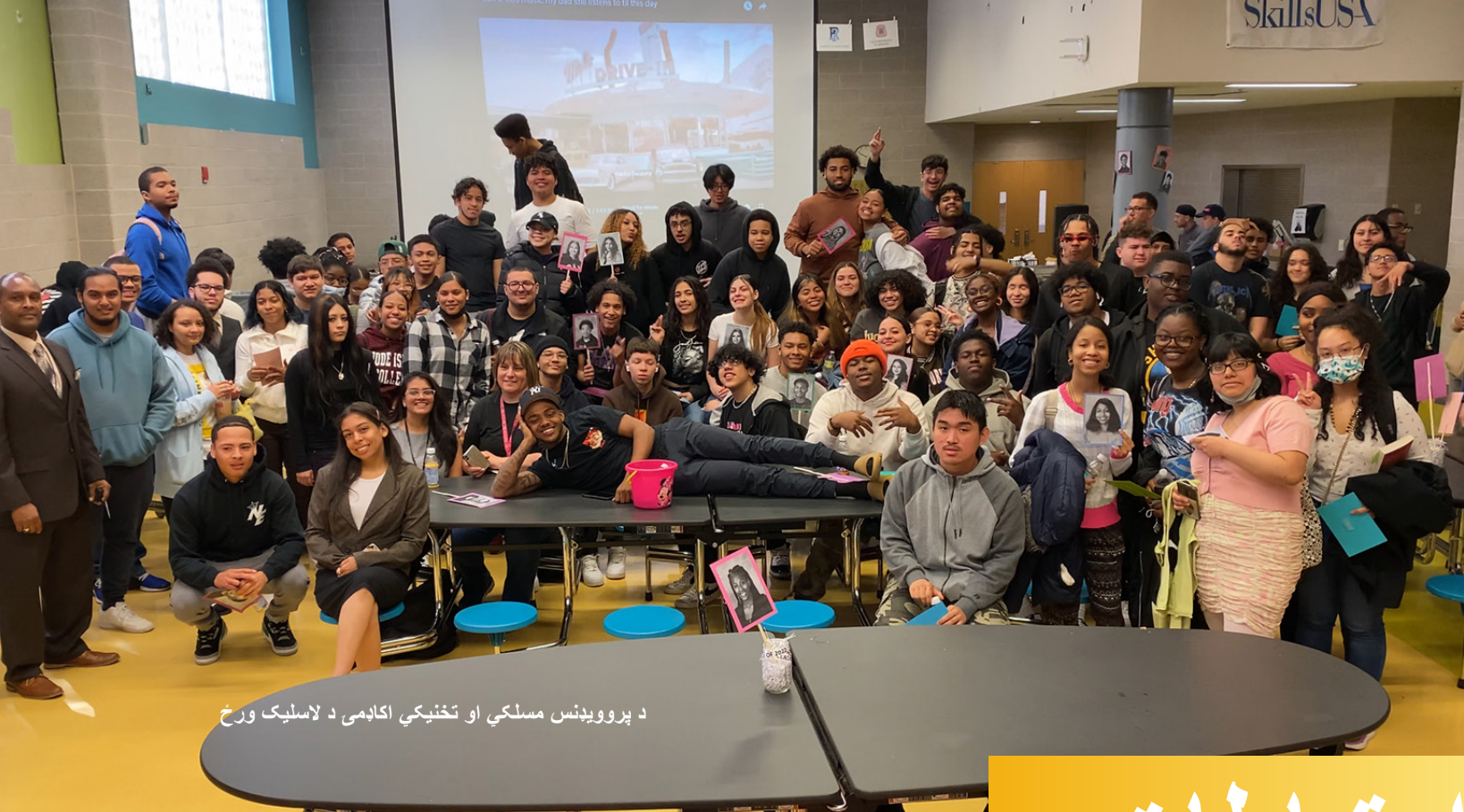
د پروویننس مسلکي او تخنیکي اکاډمۍ د لاسلیک وړخ