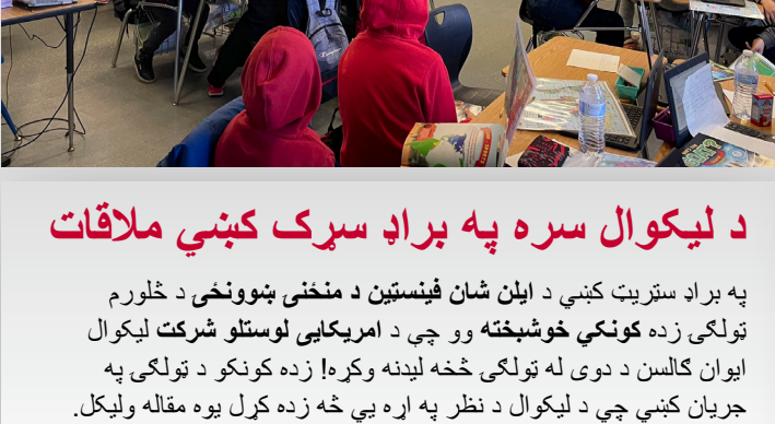
د لیکوال سره په براد سړک کې ملاقات

زموږ زیارکېدونکي، تکړه زده کوونکي هره ورځ په زړه پورې کارونه ترسره! دغه یې فقط یو څو مثالونه دي.